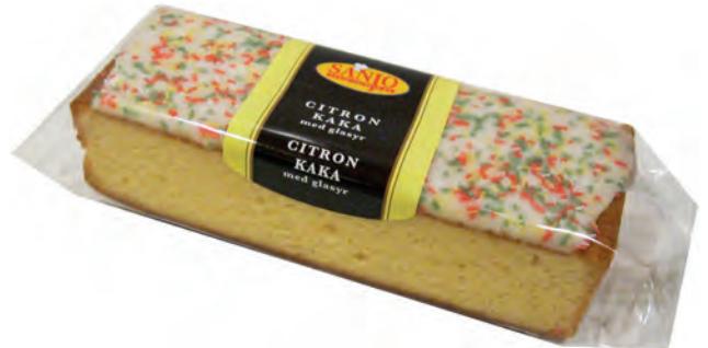
Citronkaka 350 g 6 st/ka