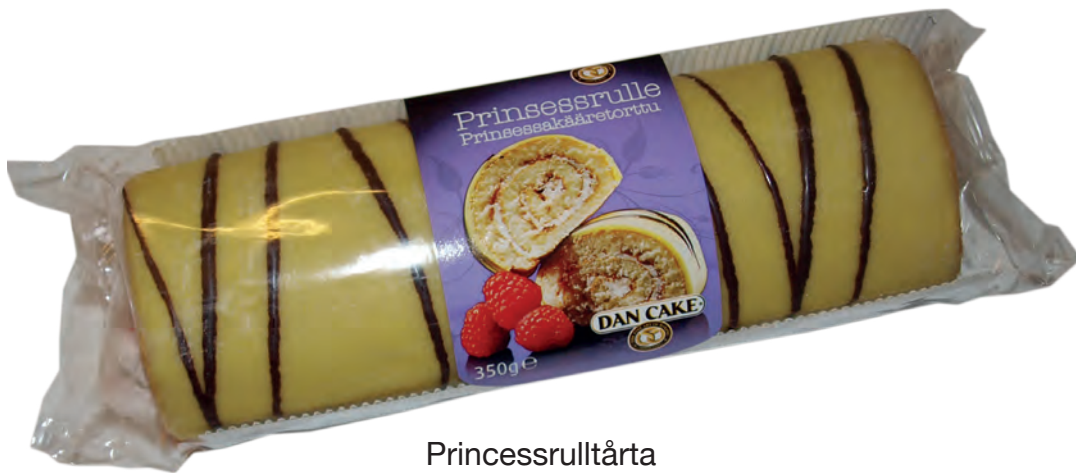
Prinsessrulltårta 350 g 5 st/ka