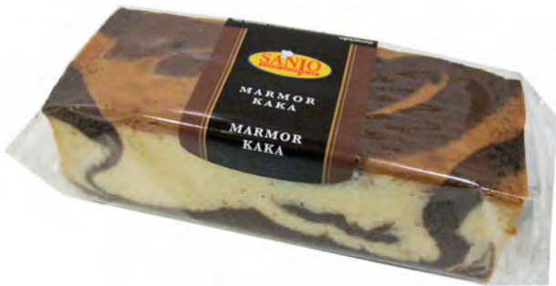
Marmorkaka 400 g 6 st/ka