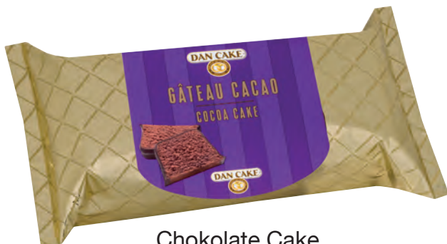
Chokolade Cake 400 g 6 st/ka